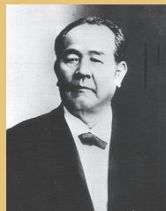
渋沢 栄一 〔1840〜1931〕